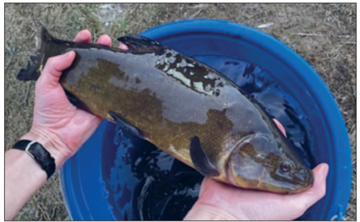
Eine schöne Schleie