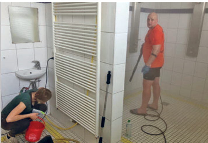
Kärchern der Duschen im Umkleidetrakt