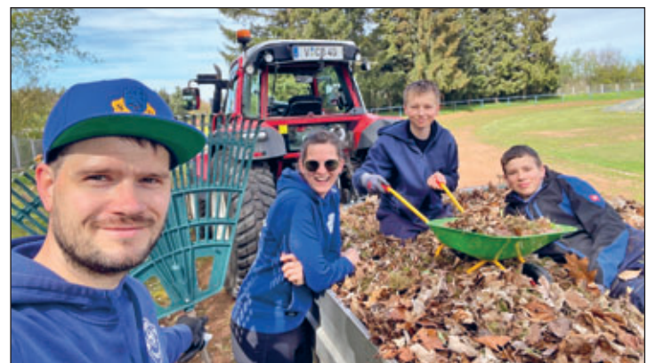
Viel Laub musste entsorgt werden...