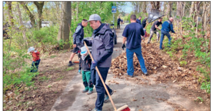
Laub und Geästbereinigung am Plattenweg unterhalb des Stadions