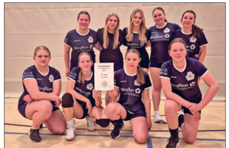
Gruppenbild der Teilnehmer zum Turnier