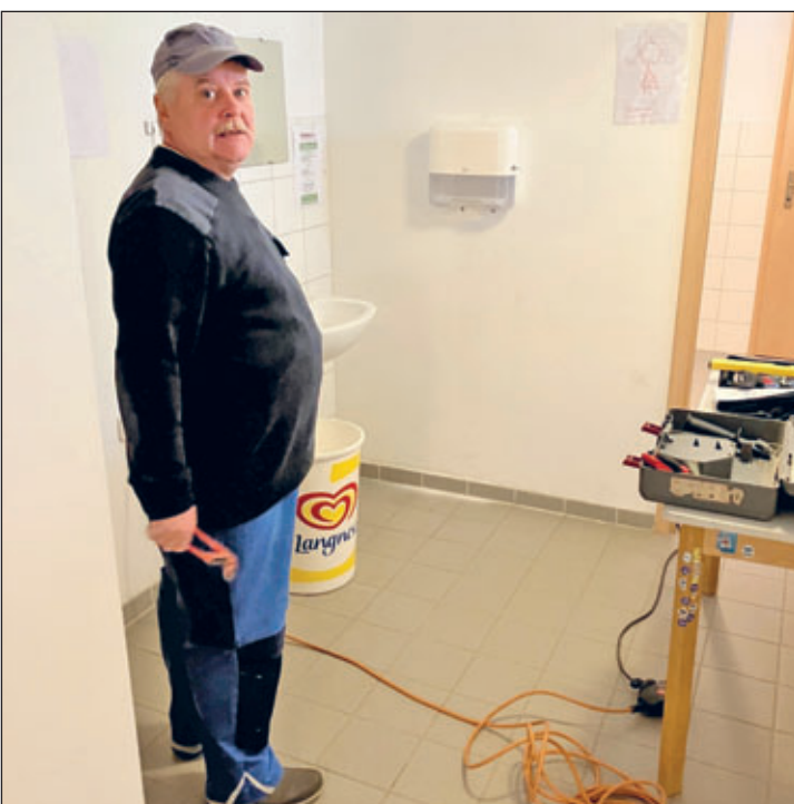
Instandhaltungsarbeiten an den WC's im Kulturhaus