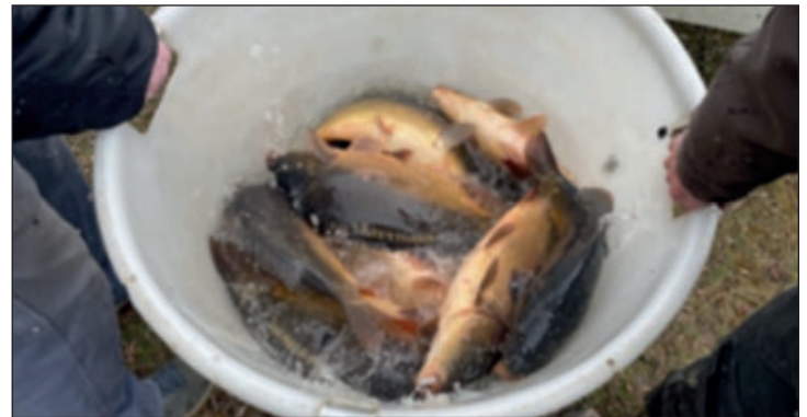
Eine Menge fangfähiger Karpfen