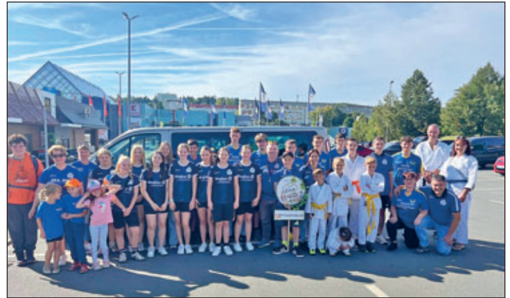
Die Teilnehmer des SVC beim Umzug der Sternquell Wiesn