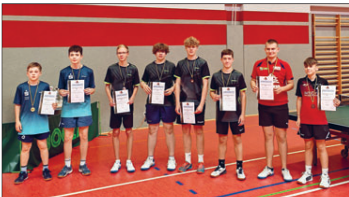
Sieger Doppel U19