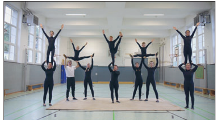
Impressionen vom Videodreh für das Vereinsgewinnspiel im Oktober