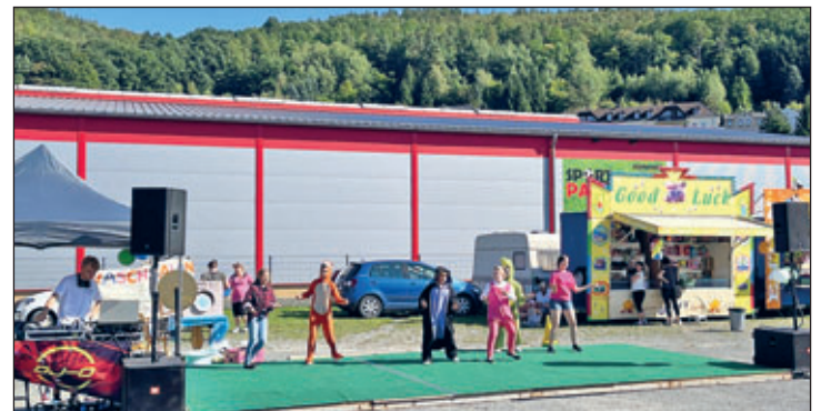
Auftritt der Kindertanzgruppe des EFC