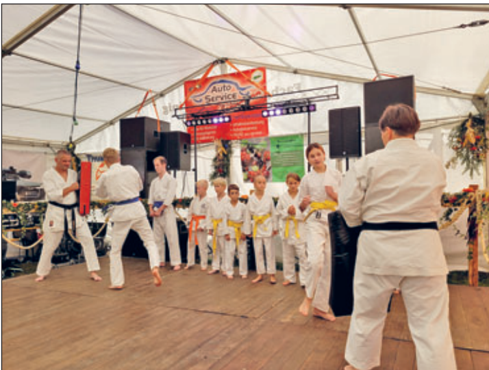
Karate Kids Elsterberg