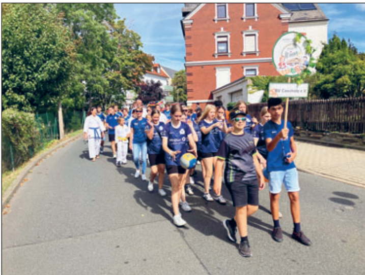
Los gings auf die knapp 1 km lange Strecke, vorneweg die Volleyball-Kids dicht gefolgt von der Karate Abteilung