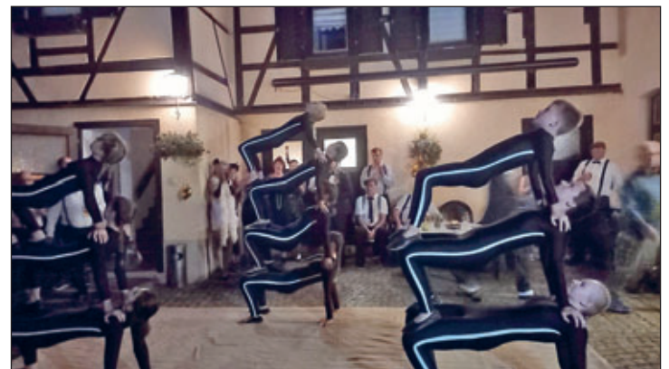
Auftritt auf einer privaten Geburtstagsfeier