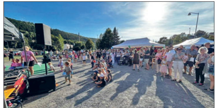
Viele Zuschauer besuchten das Fest und wurden jederzeit bestens unterhalten