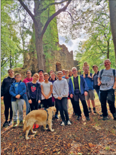
Familienwanderung am 13.09.

Nach der Sommerpause sind wir Akrobaten wieder voll durchgestartet.