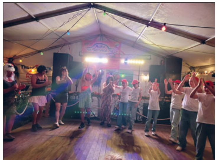
Männer- und Kinderballett Cunsdorf