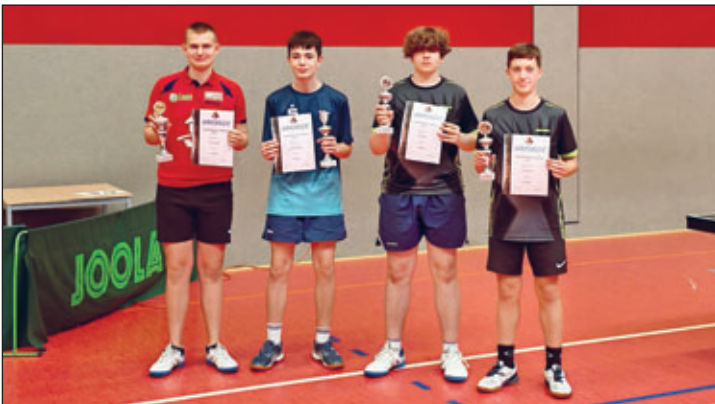
Sieger Einzel U19