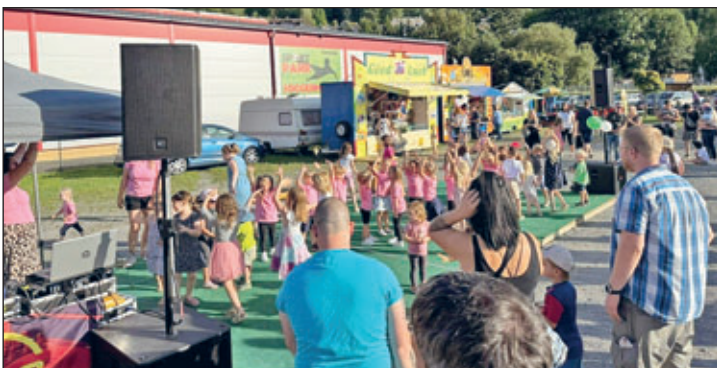
Kinderdisco mit den Minis des EFC, im Hintergrund der Schaustellerbetrieb