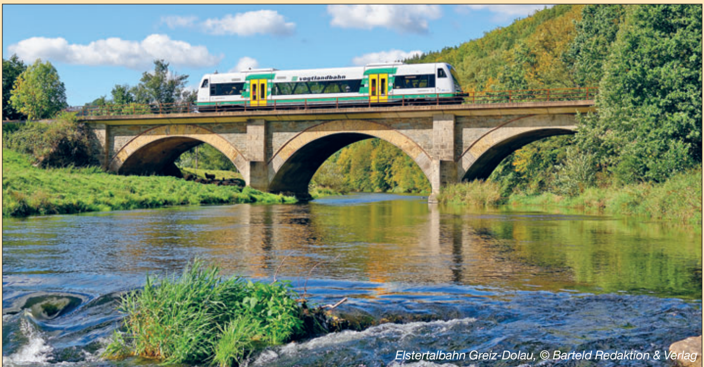
Elstertalbahn Greiz-Dolau

Am 8. September 1875 war es endlich soweit. Mit der Inbetriebnahme des zweiten Abschnittes der Elstertalbahn zwischen Greiz und Plauen erhielt die Stadt Elsterberg vor 150 Jahren eine Eisenbahnanbindung. Durch die Eisenbahn konnten Güter und Personen in wesentlich kürzerer Zeit und größeren Mengen transportiert werden. Insbesondere durch diesen Anschluss an die „große Welt“ erlebte unsere Stadt in den folgenden Jahren einen großen wirtschaftlichen Aufschwung. Es entstanden zahlreiche Betriebe, insbesondere in der Textilindustrie, aber auch Metall- und Lederverarbeitung spielten eine bedeutende Rolle. Am Sachswitzberg entstand mit der Bahnhofsvorstadt sogar ein neuer Stadtteil.