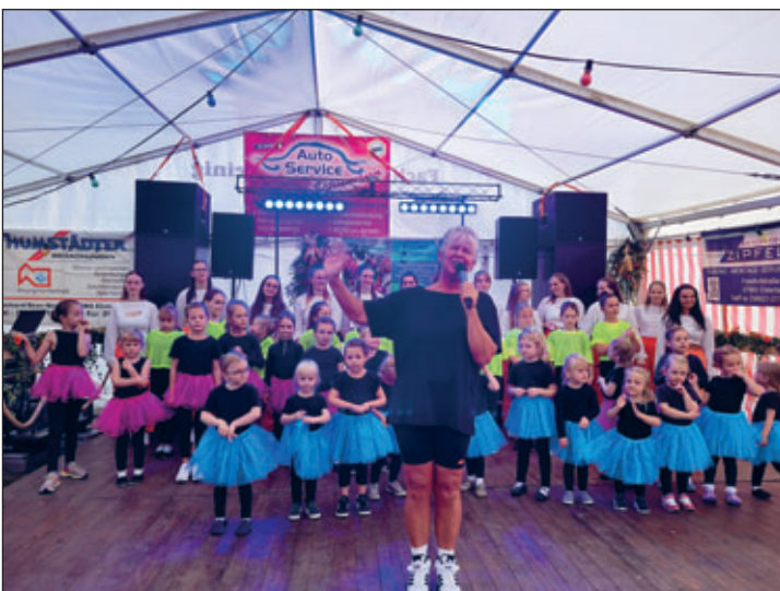
Kindertanzgruppe Topolino und Showtanzgruppe Lexis