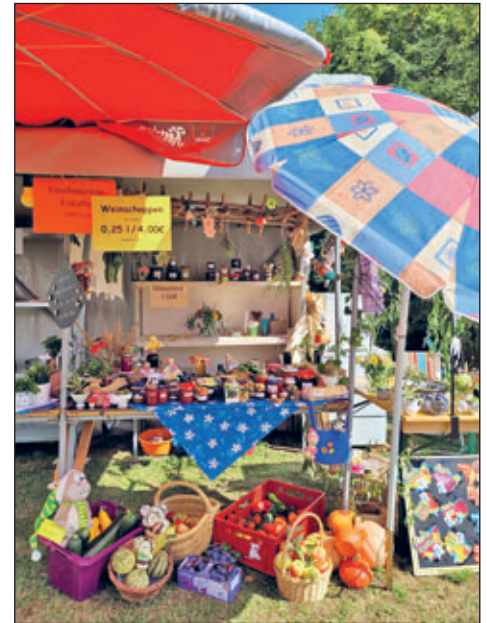
Stand ländliches Brauchtum

Wir möchten uns auf diesem Weg bei allen Sponsoren und Helfern herzlich bedanken und wünschen ihnen und ihren Familien alles Gute für die Zukunft.