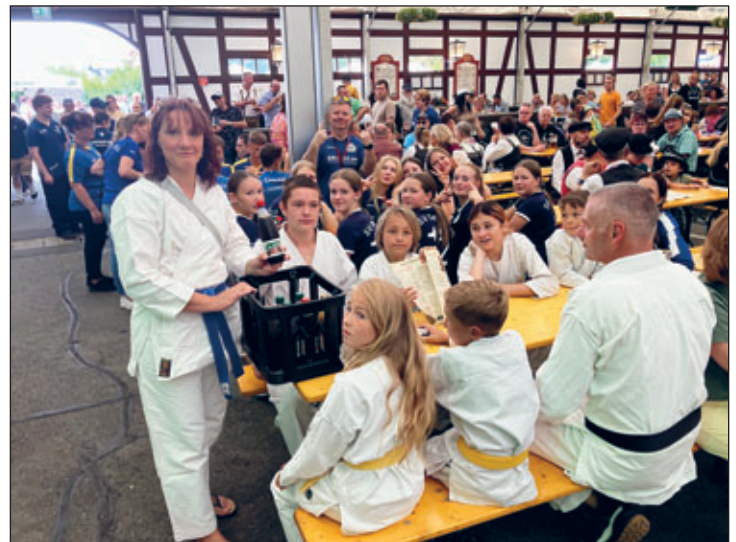
Ausklang im Festzelt mit Pommes und Bad Brambacher Limonade.