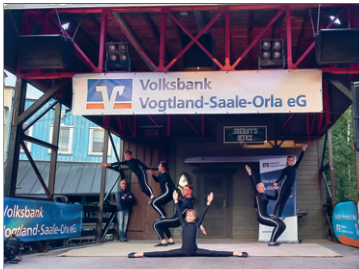
Auftritt bei Sterne des Sports

Schon in den Tagen danach ging es mit unseren Auftritten weiter. Am 6. September durften wir bei einer privaten Geburtstagsfeier unser Können zeigen. Am 17. September waren wir dann im Freizeitpark Plohn bei der Veranstaltung „Sterne des Sports“ der Volksbank Vogtland-Saale-Orla eG auf der Bühne. Ein tolles Erlebnis für alle Beteiligten, denn wir durften vorher Achterbahn fahren und den ganzen Abend dort genießen.