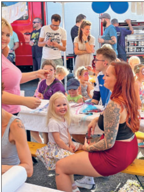
Großer Andrang bei den Glitzersträhnen und dem Kinderschminken

Diese Initiative, federführend durch den Elsterberger Ballspielclub und den Elsterberger Faschingsclub, sollte auch bei der zweiten Durchführung ein voller Erfolg werden. Mit Beginn um 14 Uhr füllte sich auch sofort das Areal und nahm bei den Tänzen der Kindertanzgruppe des EFC und dem Kindermitmachprogramm „Waldemars Waschprogramm“ vom Spiel-Spaß-Kindertreff Fahrt auf. Zu der hauseigenen Bewirtung am Grillstand, dem Bierwagen und dem Kuchenverkauf gab es auch süße Leckereien am Wagen von Quajoria. Es sollte aber natürlich nicht nur gegessen werden. Das große Angebot an Glitzertattoos und -strähnen, Hüpfburg, Torwandschießen, Glücksrad, Basteln, Kinderschminken uvm. erfreute sich großer