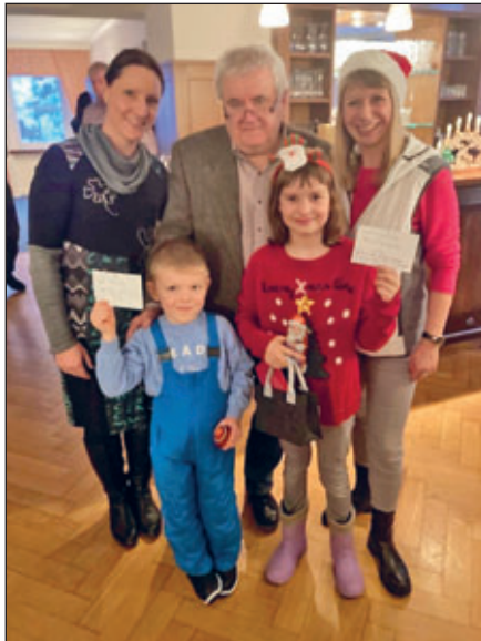
Übergabe der Sachpreise an die Ballon-Kinder