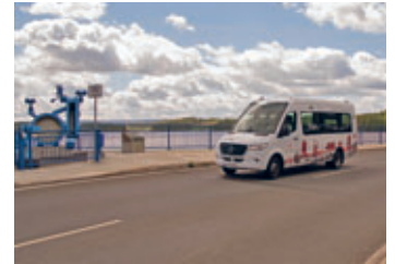
Der SaisonBus 74 auf der Stau-mauer der Talsperre Pöhl.

Zum 1. Mai 2023 startet an den Wochenenden wieder die SaisonBus-Linie 74 aus der Plauer Innenstadt zur Talsperre Pöhl. Die Linie 74 verbindet ab dem Plauer Busbahnhof, den Stadtpark, die Freizeitanlage Syratl und die zentrale Haltestelle Tunnel mit der Talsperre Pöhl, Jocketa und Thoßfell. Die Saisonlinie fährt an Wochenenden und Feiertagen vom 1. Mai bis 31. August – wochentags ist eine Voranmeldung als RufBus notwendig. In den Sommerferien Sachsens ist der SaisonBus täglich ohne Voranmeldung unterwegs.*