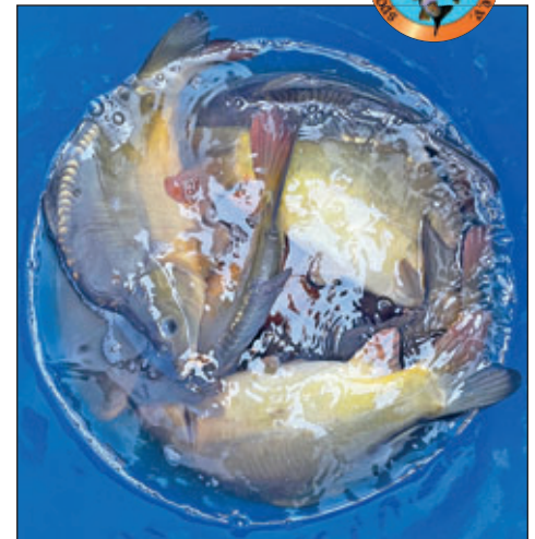
Schöne Karpfen im Transportbehälter