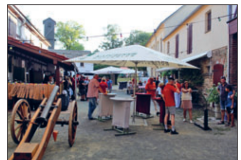
Blick in Krausens Hof, Kleingera