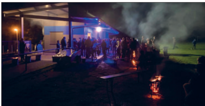
Trotz kühlem Wetter fanden viele Besucher den Weg zur Begegnungsstätte