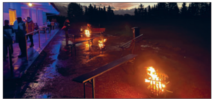
Nach dem Regenguss konnten auch die Feuerschalen gezündet werden, die später dann für wohlige Wärme sorgten.