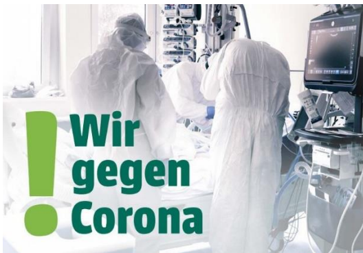
Ein Corona-Patient wird im Krankenhaus behandelt.